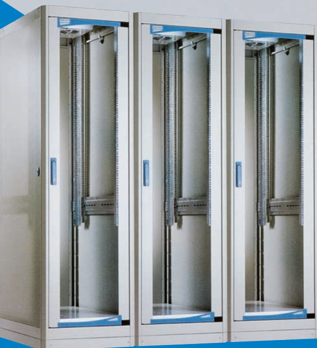
TECNO 1000 Super Server.