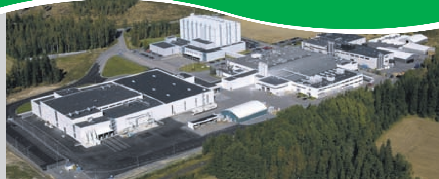
Компания ТЕКНОС запустила производство порошковых и водоразбавляемых жидких красок в г.Раямяки (Финляндия) в 1977 году. Также в г.Раямяки располагается центральный склад и учебный центр компании.