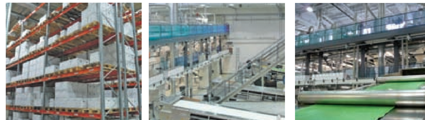
На фотографиях: завод по производству порошковых красок в г.Раямяки, Финляндия.

Система окраски выбирается в соответствии с конструкцией, основанием, желаемым сроком службы и внешним видом. Эти факторы должны сочетаться друг с другом, с методом предварительной обработки поверхности и окружающими условиями при окраске. Краски должны образовать достаточно толстый защитный слой и обеспечить экономически эффективную защиту от коррозии.